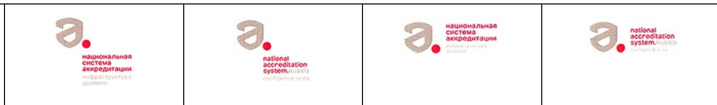
Вариант 2. Изображение знака.