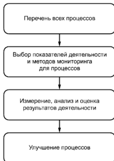
Рисунок 4 - Шаги для использования показателей деятельности

10.2.2 Методы, используемые для сбора информации в отношении показателей деятельности, следует выбирать таким образом, чтобы они были осуществимыми и подходящими для организации, например: