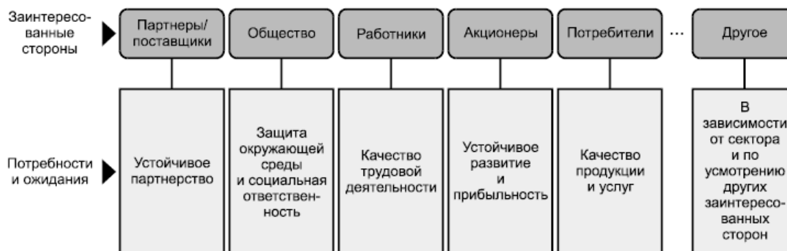
Рисунок 2 - Примеры заинтересованных сторон и их потребностей и ожиданий

Перечень заинтересованных сторон может значительно меняться с течением времени и отличаться в зависимости от организации, отрасли, культуры и страны. На рисунке 2 приведены примеры заинтересованных сторон и их потребностей и ожиданий.